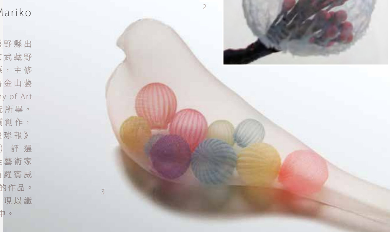
1-2 プローチ / 聚酯纖維 / 2014

藝術家，日本熊野縣出身。畢業於東京武藏野美術大學油畫系，主修油畫及版畫。舊金山藝術大學（Academy of Art University）研究所畢。早期以金屬材質創作，並被《波士頓環球報》（Boston Globe）評選為當年年最佳藝術家之一。已故演員羅賓威廉斯亦曾收藏她的作品。近年轉換材質，現以纖維藝術為主活動中。