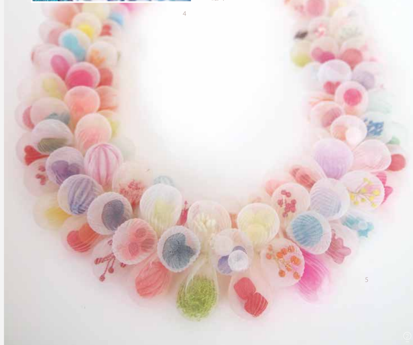
4 無題 / 聚酯纖維 / 2015

「我用金屬創作快 18 年了。要說是什麼讓我開始選擇其他媒材創作，就是對自己的既定風格感到厭倦了吧！」Kusumoto 從學生時代因學習蝕刻版畫而開始醉心金屬創作。每個作品均有引人驚奇的機關，從構思、電腦設計稿、紙製樣本、到拼接不同金屬等皆需龐大而縝密的準備才能完成。「以 18 年為分野，我想嘗試不能具體說出那是什麼的抽象概念，和完全異於金屬的材質創作。」而她所選擇的，是與堅硬金屬完全相反的聚酯纖維布。