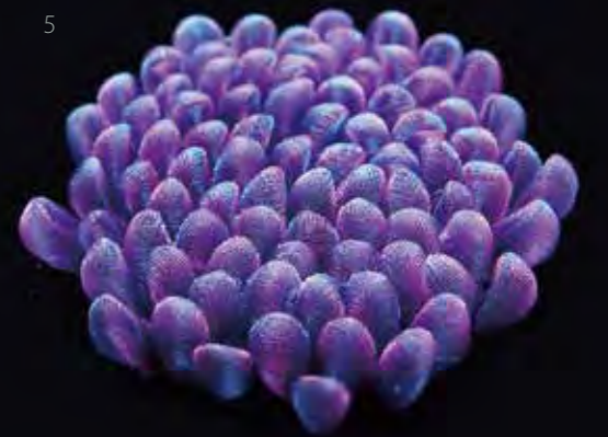
5 パープルフラワー / 聚酯纖維 / 2014

除了加工成別針或耳環等飾品，目前 Kusumoto 也在考慮製作大型雕刻，甚至和金屬作結合。她相信藝術不是完全由人的想法創造。從製作或試作的過程中，偶然迸發出的美感也是關鍵。因此所有嘗試都是在把生活中的驚異和想法都加進作品中。「我從來不是放棄金屬創作，而是為了翻新自己的創作心態才以布為媒材，或許不久後就會開始重拾金屬。我想以超越任何規範的自由想像去找尋靈感和創作。」 dpi